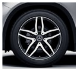
45,7 cm (18-palčna) platišča iz lahke kovine (01R)