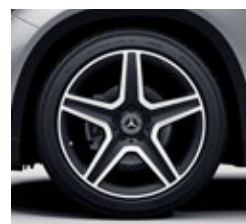
48,3 cm (19-palčna) platišča iz lahke kovine AMG (655)