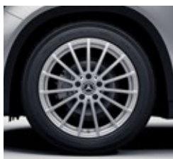
45,7 cm (18-palčna) platišča iz lahke kovine (04R)