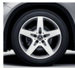
45,7 cm (18-palčna) platišča iz lahke kovine AMG (633)