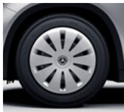
43,2 cm (17-palčna) platišča iz lahke kovine (R00)