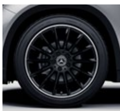
48,3 cm (19-palčna) platišča iz lahke kovine AMG (RVI)