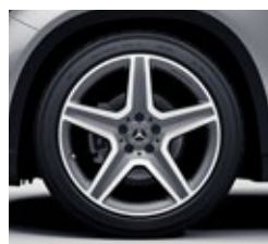
48,3 cm (19-palčna) platišča iz lahke kovine AMG (635)