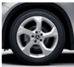
45,7 cm (18-palčna) platišča iz lahke kovine (82R)