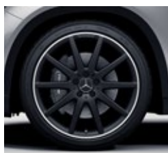
50,8 cm (20-palčna) platišča iz lahke kovine AMG (778)