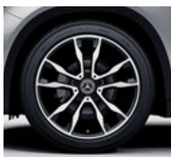
48,3 cm (19-palčna) platišča iz lahke kovine (65R)