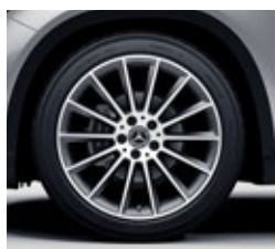
48,3 cm (19-palčna) platišča iz lahke kovine AMG (RVJ)