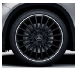
50,8 cm (20-palčna) platišča iz lahke kovine AMG (RVV)