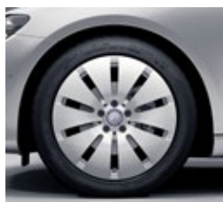
45,7 cm (18-palčna) platišča iz lahke kovine (R41)