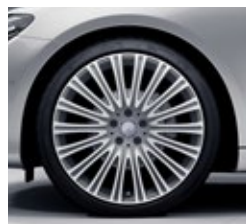
50,8 cm (20-palčna) platišča iz lahke kovine (17R)