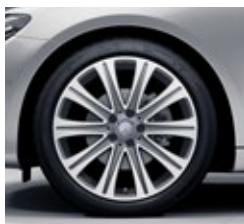
48,3 cm (19-palčna) platišča iz lahke kovine (R97)