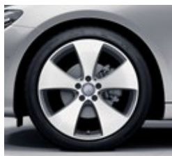
48,3 cm (19-palčna) platišča iz lahke kovine (48R)