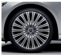
50,8 cm (20-palčna) platišča iz lahke kovine (R17R)