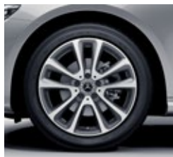
45,7 cm (18-palčna) platišča iz lahke kovine (R22R)