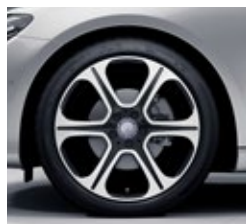
48,3 cm (19-palčna) platišča iz lahke kovine (R83)