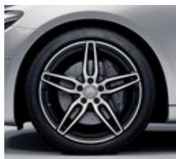
48,3 cm (19-palčna) platišča iz lahke kovine AMG (RTE)