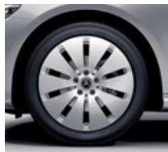
45,7 cm (18-palčna) platišča iz lahke kovine (R41)