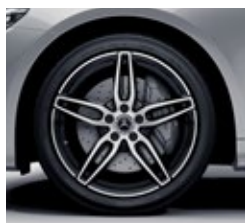
48,3 cm (19-palčna) platišča iz lahke kovine AMG (RTE)