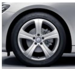
45,7 cm (18-palčna) platišča iz lahke kovine (R96)