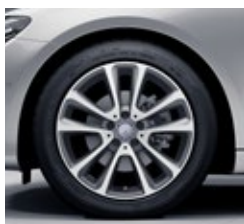
45,7 cm (18-palčna) platišča iz lahke kovine (22R)