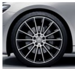
50,8 cm (20-palčna) platišča iz lahke kovine AMG (RVR)