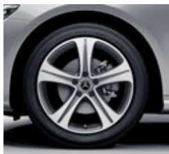
45,7 cm (18-palčna) platišča iz lahke kovine (R31)