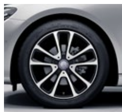
45,7 cm (18-palčna) platišča iz lahke kovine (R10)