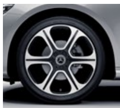
48,3 cm (19-palčna) platišča iz lahke kovine (R83)