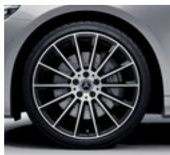
50,8 cm (20-palčna) platišča iz lahke kovine AMG (RVR)