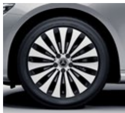
45,7 cm (18-palčna) platišča iz lahke kovine (O4R)