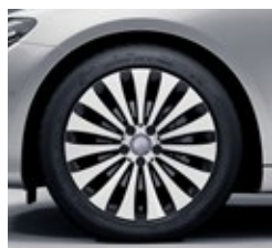
45,7 cm (18-palčna) platišča iz lahke kovine (O4R)