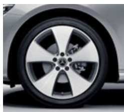
48,3 cm (19-palčna) platišča iz lahke kovine (R48R)