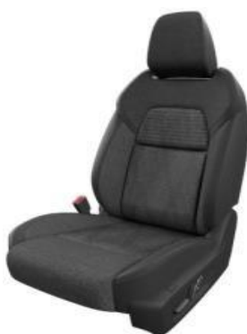
SEDEŽI V KOMBINACIJI TKANINE IN UMETNEGA USNJA V ČRNI BARVI (G)