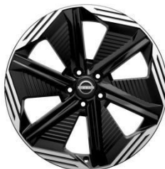
51 CM (20") ALU PLATIŠČA N-DESIGN