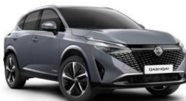
CERAMIC SIVA (KBY)