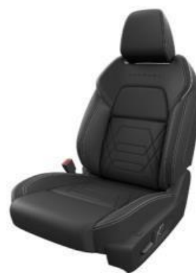
SEDEŽI V KOMBINACIJI PREŠITEGA USNJA TER ALCANTARE V ČRNI BARVI (Z)