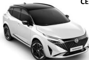
PEARL BELA / ČRNA STREHA (XKJ)