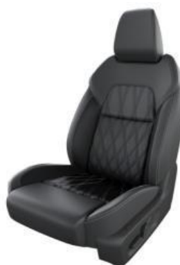
NAPPA USNJE (Z)