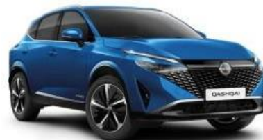
MAGNETIC MODRA (RCF)