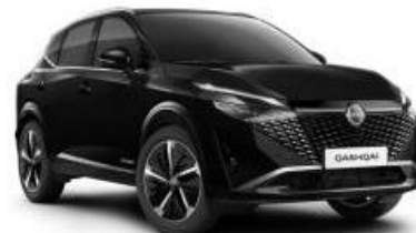
PERLA ČRNA (GAT)