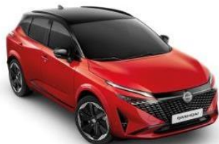
FUJI SUNSET / ČRNA STREHA (YAU)