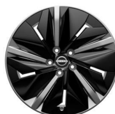
48 CM (19") ALU PLATIŠČA