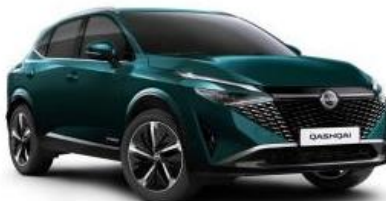
DEEP OCEAN (FAP)