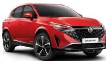
FUJI SUNSET (NBV)