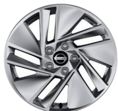
43 CM (17") ALU PLATIŠČA