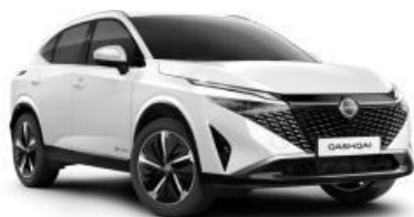
PEARL BELA (QBE)