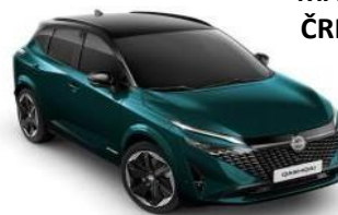
DEEP OCEAN / ČRNA STREHA (YBJ)