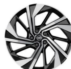
51 CM (20") ALU PLATIŠČA