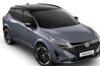
CERAMIC SIVA / ČRNA STREHA (XEX)